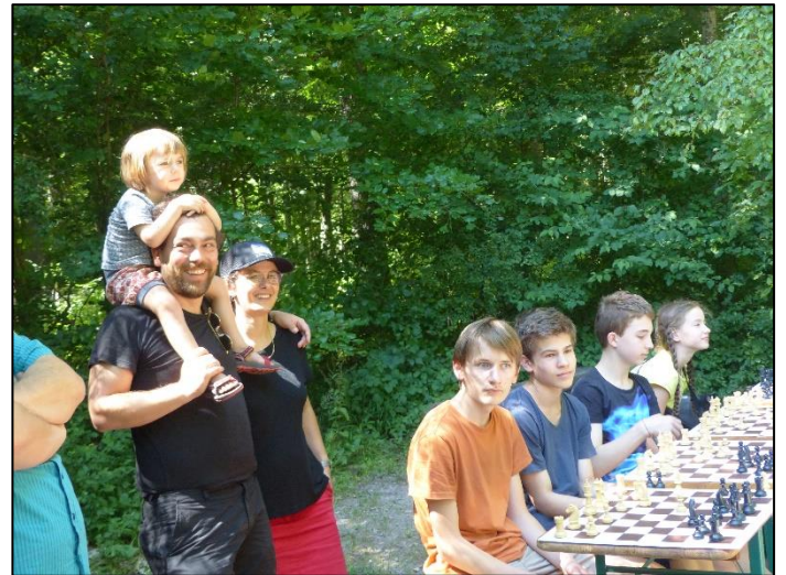
ZuschauerInnen beim Simultan