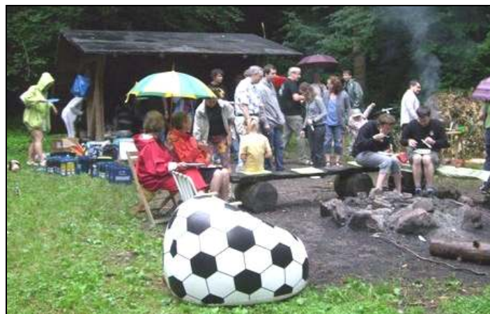
„Sommer“-Fest am 17.07.2010 (total verregnet)