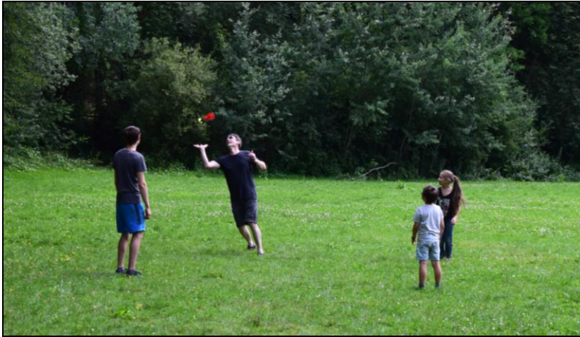
Wie jedes Jahr: Fußball und Indiaca