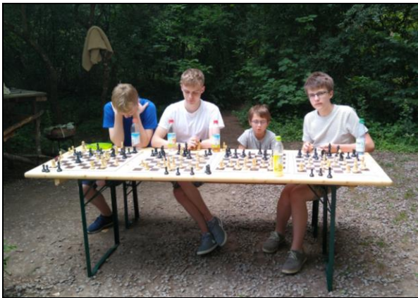
Das traditionelle Simultan des Vereinsjugendmeisters