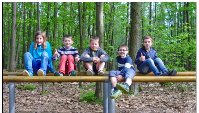
Auf dem Trimm-Dich-Pfad